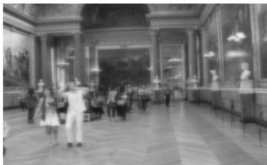
Obrázek 3: simulace vidění krátkozrakého pomocí spojné čočky

Základní vyšetření: stanovení objektivního a subjektivní zrakové ostrosti obou očí zvlášť, ověření binokulární spolupráce pomocí polarizačních nebo bichromatických testů, stanovení adice pro pracovní vzdálenost.