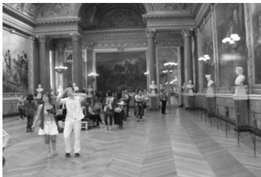
Obrázek 2: jak vidí emetrop

doplňková vyšetření, prokázání refrakční vady a její následná korekce. Při rozhovoru s klientem je nezbytné aktivně pátrat po chorobách, které mají určitý genetický základ. Například rodinný výskyt zeleného zákalu, katarakty, keratokonusu, degenerativního onemocnění sítnice, choroby žluté skvrny, šilhání či tupozrakosti. Vlastní vyšetření pak zahájíme Anamnestické příznaky – astenopie až dvojitě vidění při práci do blízka (hypermetropie), horší vidění do dálky za šera- krátkozrakost nižšího stupně, neostře vidění do dálky i na běžnou pracovní vzdálenost těžká myopie. Klinické příznaky lze simulovat pomocí korekčních skel, jak vidí pacienti s jednotlivými refrakčními vadami.